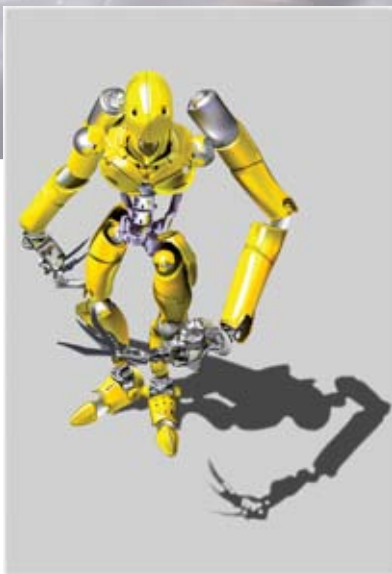
Illustrations diverses 2003-2008